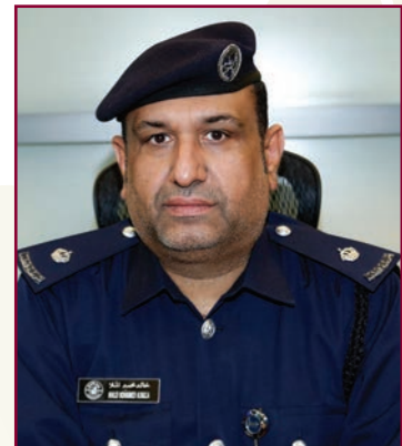
Major Khalid Al-Mulla

Arab countries and six months for a European country. It's important to make sure that all the passports and tickets are with them before starting from home. He advised the passengers to update leave notification well in advance and to reach the airport before three hours prior to flight departure to complete the procedures with ease. He reminds the passengers on the importance of following instructions and alerts of security personnel and staffs of the Department because they always work to their advantage.