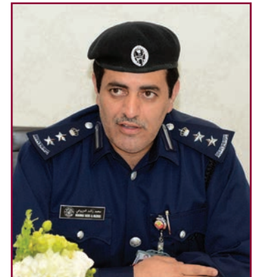
Col. Muhammad Al. Mazroui

developments related to aviation security through the use of modern equipment and raising the efficiency of the human elements capable of dealing with the modern security system, he added.