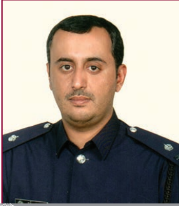
الرائد/خالد آل ثاني

ويشير إلى أن هذه المشكلة ناتجة عن عدم دراية مستخدمي هذه الطائرات بالقرب من الأماكن