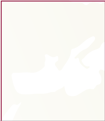
Col. Khaled Al-boenen

such as bacteria and germs. Transporting animals and birds through the Hamad International Airport is subject to the procedures and guidelines set by the airline carrier, although Airport Security Department prevents animals that pose a danger to passengers or animals that were placed in cages not conform to the specifications and requirements for safety and security.