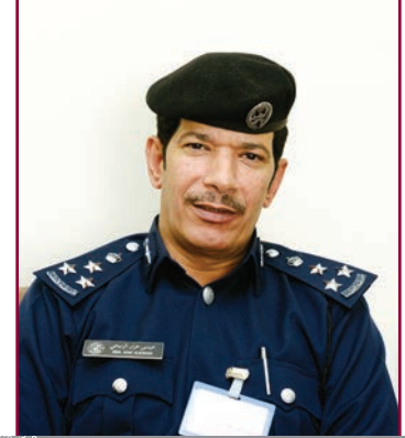
العميد/ عيسى عرار الرميحي

تكنولوجية تحد من هذه الطائرات في مناطق الحظر وهو ما يلعب دوراً مهماً في الحد من مخاطرها .