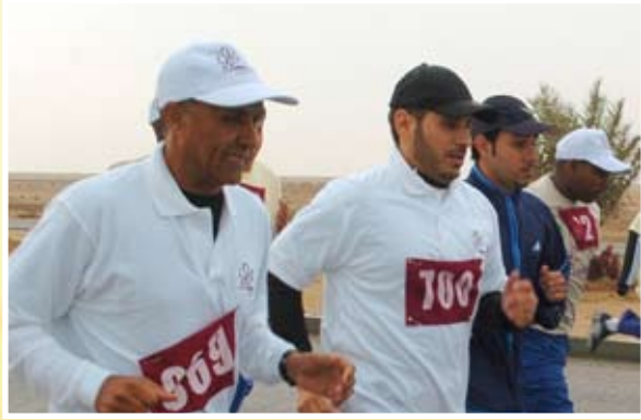
سعادته يشارك في السباق