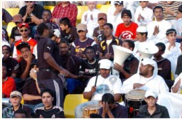
تشجيع حماسي رائع

على مدار ٢٠ يوما تقريبا في خروج البطولة بصورة طيبة . واستطرد مضيفا في تصريحه الصحافي أن فريقنا (لخويا) وإدارة المرور قدما مباراة قوية تليق بنهائي البطولة التي جندت كل الطاقات لإنجاحها وشهدت منافسات شريفة طوال الفترة السابقة بين كافة الفرق التي قدمت مستويات جيدة من أول مباراة وحتى آخر مباراة مؤكدا أن الكل فائز في النهائي ولا يوجد خاسر فقد ساهم الجميع في خروج البطولة بهذه الصورة الرائعة .. وأضاف أن البطولة هذا العام اكتسبت أهمية خاصة أن اتحاد الشرطة الرياضي وفر كافة المستلزمات والتسهيلات التي من شأنها مساعدة الجميع على النجاح والمساهمة بدورهم في إبراز البطولة بصورة مشرفة وتليق بالرياضة الشرطة بالدولة.