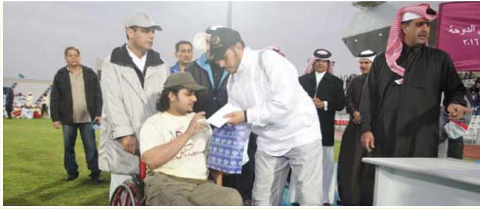
سعادة الوزير يكرم أحد المتسابقين

برعاية ومشاركة سعادة الشيخ/ عبد الله بن ناصر بن خليفة آل ثاني وزير الدولة للشئون الداخلية نظم الاتحاد الرياضي القطري للشرطة بطولة الشرطة المفتوحة الخامسة لاختراق الضاحية في مدينة الخور تحت شعار (الدوحة ٢٠١٦ - حلم شعب) عصر الجمعة ١١/١/٢٠٠٨ م ، وجاءت مشاركة سعادة الوزير إلى جانب ١٥٠٠ متسابق ومتسابقة من مختلف شرائح المجتمع القطري من مواطنين ومقيمين .