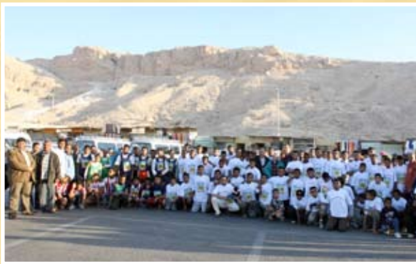
المشاركون في السباق بعد الماراثون

أضاف أبطال الشرطة لألعاب القوى انجازا رياضيا جديدا بفوزهم بما راثون مصر الدولي الذي أقيم منتصف فبراير ٢٠٠٧م بمدينة الاقصر بجمهورية مصر العربية الشقيقة وسط مشاركة ١٦٠٠ عداء يمثلون ٢٢ دولة أوروبية وآسيوية وإفريقية حيث حصد أبطالنا المراكز الأولى في سباق ١٢ كيلو ونصف ماراثون ٢٢ كيلو.