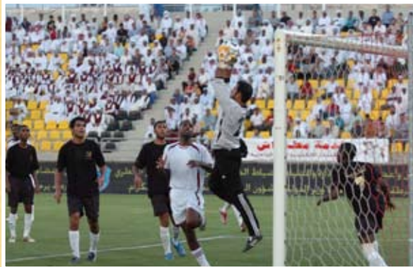
ندية . إثارة . ومباراة حماسية