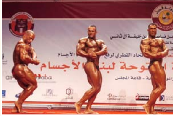
استعراض على أنغام الموسيقى