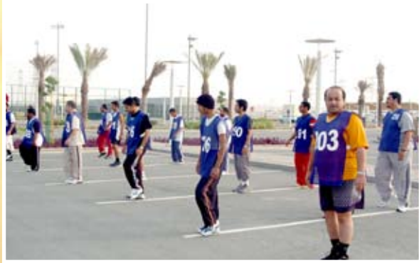
إحماء قبل الاختبار

خضع منتسبو ومنتسبات قوة الشرطة لاختبارات اللياقة البدنية وفق معايير طبية وفنية سليمة ، وجرت الاختبارات في نادي الريان الرياضي في الفترة من ١-٢٠/٤/٢٠٠٧م للدور الأول وخلال الفترة من ٦-٢١/٥/٢٠٠٧م للدور الثاني. وشكلت لجنة من بعض الضباط وصف الضباط للقيام بالفحص الميداني بينما شكلت لجنة أخرى إدارية لوضع الدرجات النهائية للخاضعين للاختبار.