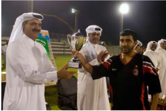
كأس البطولة لفريق لخويا

حقق فريق الأمن الداخلي « لخويا » لقب بطولة الشرطة الرمضانية لسداسيات كرة القدم بعد الفوز في المباراة النهائية علي الدفاع المدني ٢-٠ صفر في المباراة التي أقيمت بينهما بملعب نادي المريخية الرياضي وسط حضور جماهيري للفريقين..