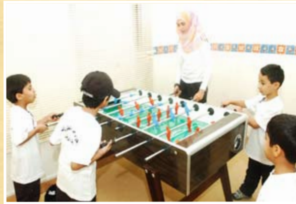
تنافس قوي في إحدى الألعاب