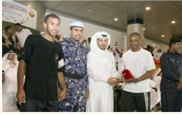
كأس البطولة .. وفرحة الفوز