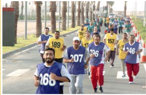
اختبارات الركض ...

خضع منتسبو ومنتسبات قوة الشرطة لاختبارات اللياقة البدنية وفق معايير طبية وفنية سليمة ، وجرت الاختبارات في نادي الريان الرياضي في الفترة من ١-٢٠/٤/٢٠٠٧م للدور الأول وخلال الفترة من ٦-٢١/٥/٢٠٠٧م للدور الثاني. وشكلت لجنة من بعض الضباط وصف الضباط للقيام بالفحص الميداني بينما شكلت لجنة أخرى إدارية لوضع الدرجات النهائية للخاضعين للاختبار.