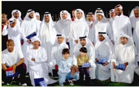
سعادته .. مع بعض قدامى لاعبي الشرطة

القطري للشرطة على نجاحهم في تنظيم البطولة والإعداد لها معبرا عن سروره للمستوى الجيد الذي قدمه فريقا لخويا والمرور في النهائي مؤكدا أن الأداء الطيب والروح العالية والإصرار على تحقيق الفوز كانت حاضرة لدى الجميع وقال أن (فريق) لخويا استحق اللقب بحكم لياقتهم العالية التي ساعدتهم على هذا الأداء المتميز طوال مشوار البطولة .