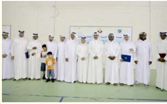
مسئولو الاتحادات في صورة تذكارية