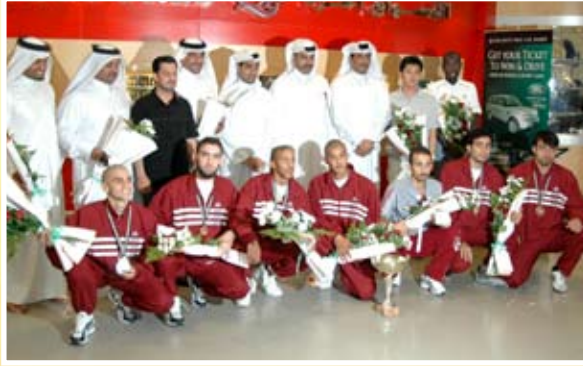
استقبال الأبطال بعد وصولهم مطار الدوحة