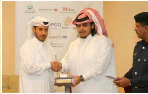
ويتبادل الهدايا مع الشيخ / جاسم بن حمد بن ناصر آل ثاني