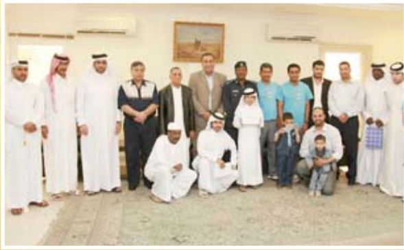
صورة تذكارية للفائزين والمكرمين