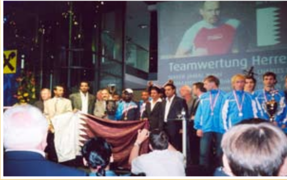
أبطال قطر على منصة التتويج بالنمسا