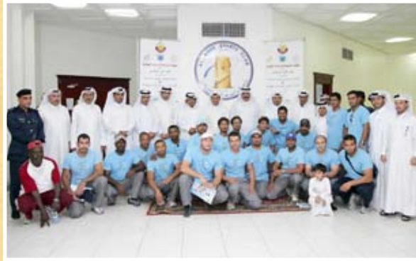
سعادته مع أسرة الاتحاد