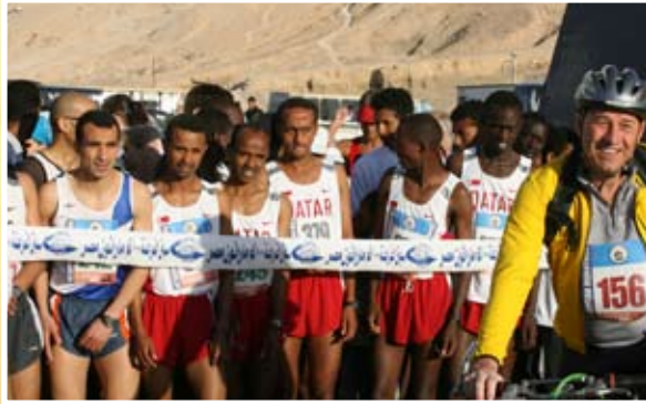
أبطال قطري في بداية السباق