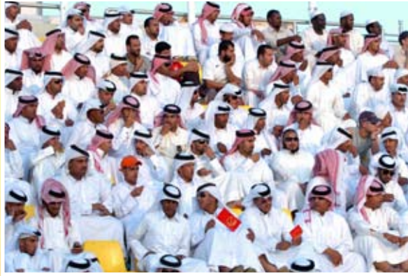
حضور جماهيري متميز