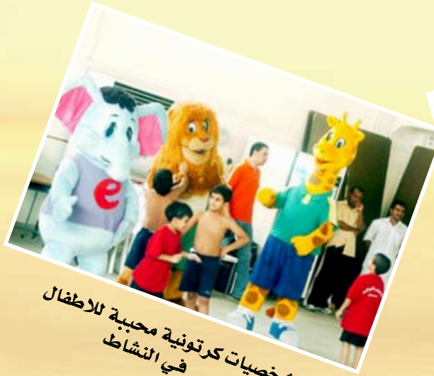
شخصيات كرتونية محببة للأطفال في النشاط