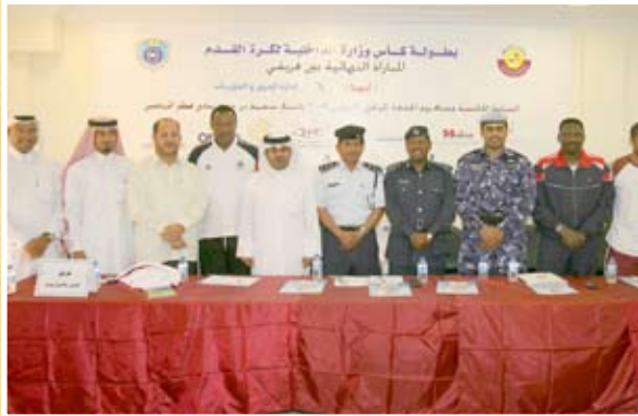
المؤتمر الصحفي قبل المباراة النهائية

– أمن العاصمة- المرور) والثانية (الداخلية- الدفاع المدني – أمن الدولة ) ويتكون كل فريق من (٢٠) لاعبا يكونون التشكيلة الأساسية للفريق والاحتياطي ، وتجري خمسة تبديلات لكل فريق أثناء المباراة التي حددت من شوطين(٤٥) دقيقة لكل شوط وتتخللها فترة راحة لمدة (١٥) دقيقة ، واشترط الاتحاد الرياضي القطري للشرطة الذي ينظم هذه البطولة حضور الفرق المشاركة قبل موعد المباراة ب(٢٠) دقيقة التقيد بألوان الملابس التي تم إقرارها ، وجاء في نظام وشروط كأس وزارة الداخلية اعتبار الفريق المنسحب في أية مباراة مهزوما (٢/صفر) وإيقاف اللاعب لمباراة في حالة حصوله على إنذارين ، وإيقافه لمباراة في حالة الطرد وسقوط الإنذارات في حالة وصول الفريق إلى الأدوار النهائية.وكانت بداية جميع المباريات في تمام الساعة السابعة صباحا في ملعب نادي السد عدا المباراة النهائية التي أقيمت في ملعب سحيم بن حمد بنادي قطر الرياضي.