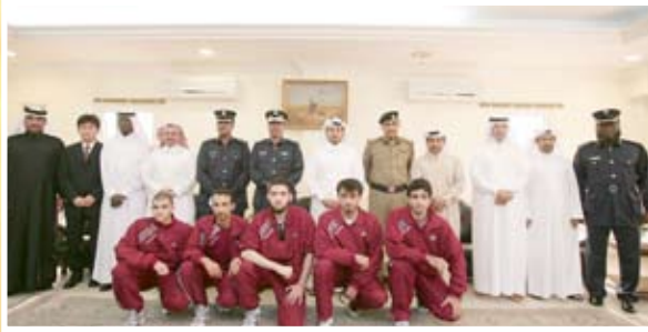
سعادة وزير الشؤون الداخلية في صورة تذكارية مع الأبطال