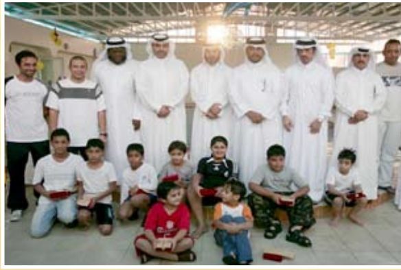
الفائزون في المسابقة