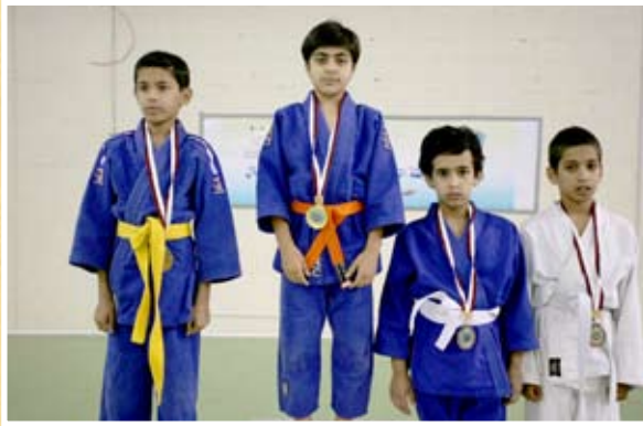
الفائزون في البطولة من الأشبال

نظم الاتحاد الرياضي القطري للشرطة بطولة الشرطة الثانية للجودو للناشئين والأشبال في ١٢/١٠/٢٠٠٦م بصالة نادي السد الرياضي على هامش توقيع بروتوكولات رياضية بين الاتحاد ونادي السد من جهة والاتحاد القطري للجودو من جهة أخرى