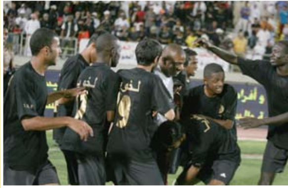
لاعبو لخويا .. سعداء بالفوز