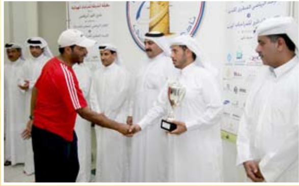
كأس البطولة لفريق المعهد ...