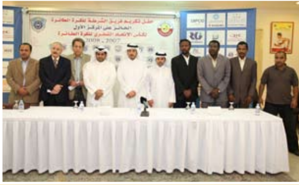
وسعاداته مع رجال الإعلام