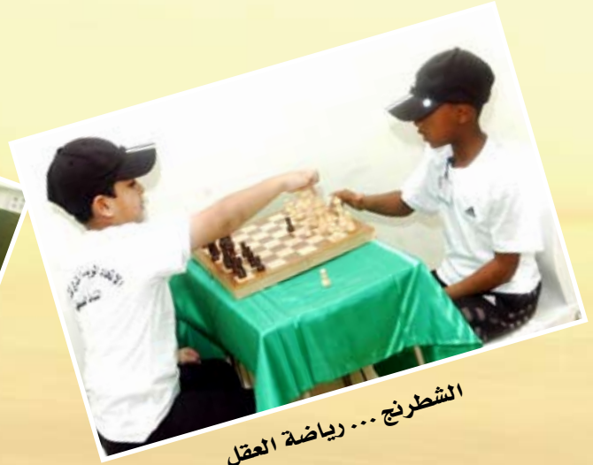
الشطرنج... رياضة العقل