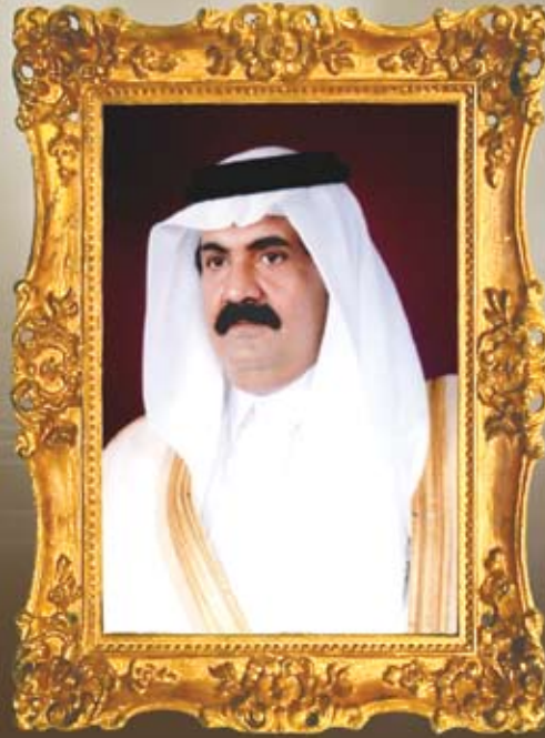
حضرة صاحب السمو الشيخ / حمد بن خليفة آل ثاني أمير البلاد القطري