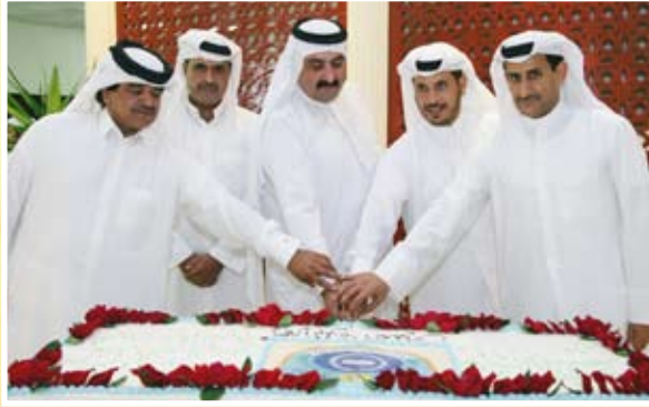
احتفالاً بالاداء المتميز لنادي الخور في عام ٢٠٠٧م