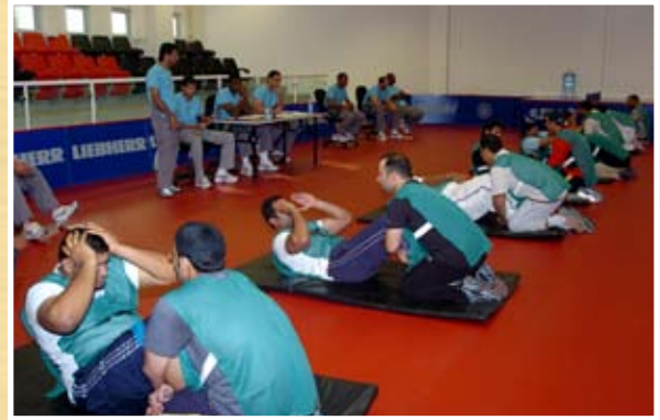
اختبارات عضلات البطن