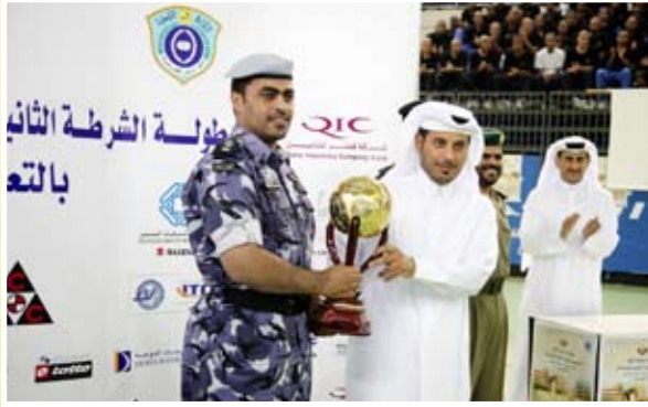
كأس البطولة لفريق لخويا (ب)