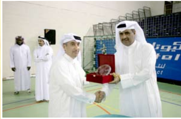
رئيس الاتحاد وأمين السر بنادي السد