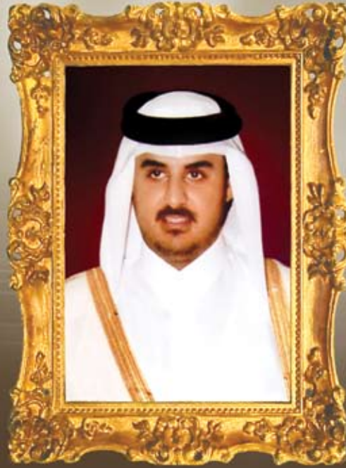
سمو الشيخ تميم بن حمد آل ثاني ولي العهد الأمين