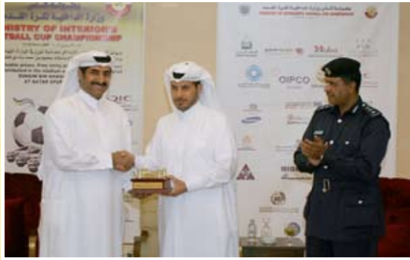
وسعادته يكرم سعادة اللواء الركن / حمد بن علي العطية